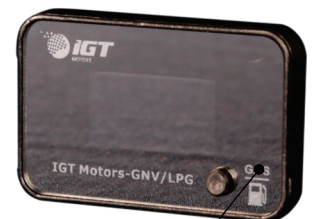
SWITCH DIGITAL IGSW Z4D